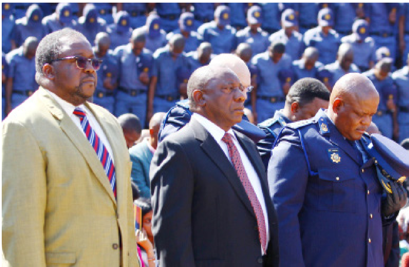
Deputy President Cyril Ramaphosa (centre), Minister Nkosinathi Nhleko, and Acting National Commissioner Kgomotso Phahlane during the South African Police Services' Annual Commemoration Day.