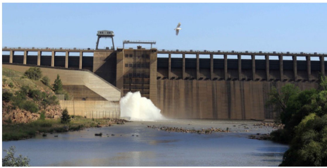
Deur wykskomitees kan lede van die gemeenskap insette lewer oor besluite wat in hul plaaslike rade gemaak word.