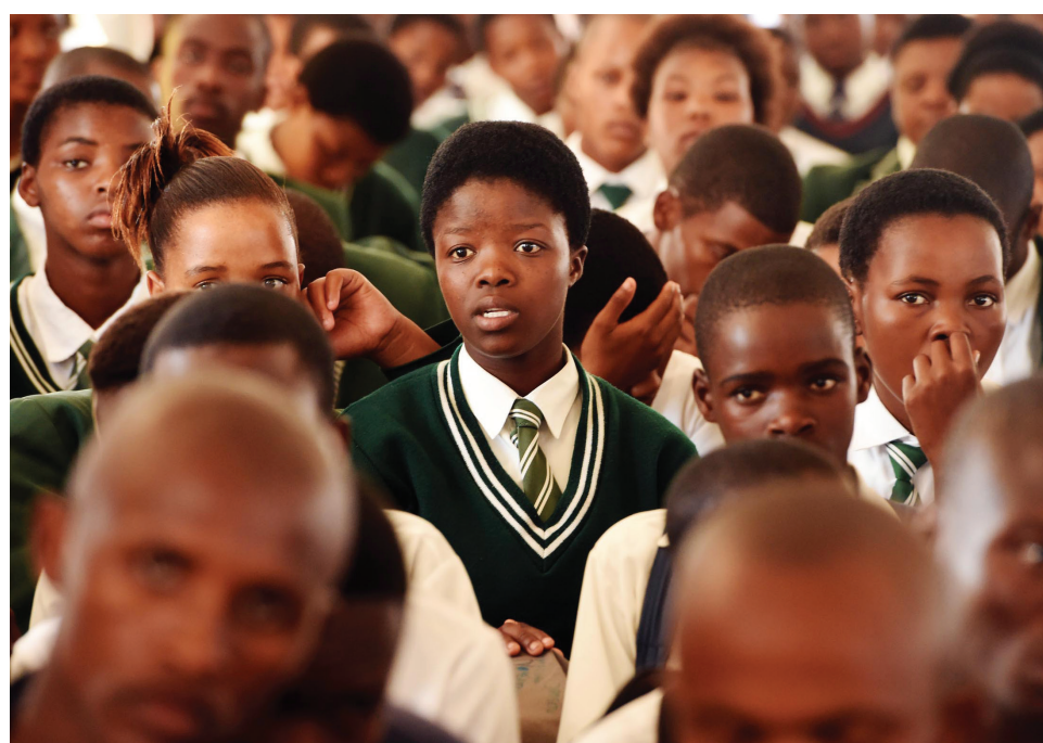
■ Die NYDA brei sy dienste tans uit na jong Suid-Afrikaners in townships en landelike gebiede.