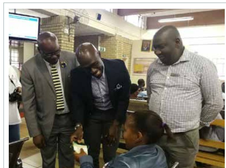
■ Letona la Lefapha la Merero ya Lehae Malusi Gigaba o re lefapha la hae le tla sebedisa moralo wa ketso ho fedisa mela e metelele.

Pele ho phatlalatsa ya meralo ya ketso, lefapha le ile la sebedisa pehelo ya tekolo e le ho fumana mokgwa o lokileng ka ho fetisisa wa ho laola mela le