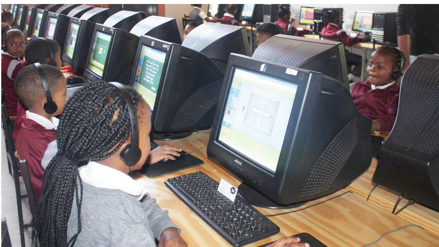
■ Placing key ICT devices in the hands of our teachers and learners has the potential to break the digital divide

OR Tambo addressing the Conference of the Women's Section of the ANC in 1981: "The mobilisation of women is the task, not only of women alone, or of men alone, but of all of us, men and women alike, comrades in struggle."