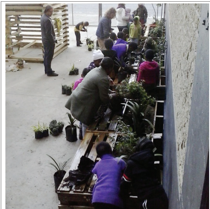
■ Bring groenbewustheid na die skoolomgewing.

Die skool se klein konstruksiebegroting het gelei tot prysens-