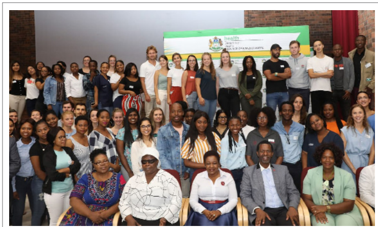
Meer as 200 jong gesondheidswerkers is gereed om gemeenskappe in verskillende dele van landelike KwaZulu-Natal te help as deel van hulle indiensopleiding.

Die 2019-groep gemeenskapsdiensbeamptes sluit tandartse, fisioterapeute, arbeidsterapeute, spraakterapeute en oudioloë in. Die instelling van verpligte gemeenskapsdiens in gesondheid het tydens die 1998/99-boekjaar begin toe voormalige President Nel-