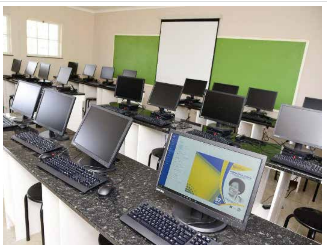
■ Computers donated by the Eastern Cape Department of Education and the Industrial Development Corporation to the Albertina Sisulu Primary School in Tsomo in the Eastern Cape.