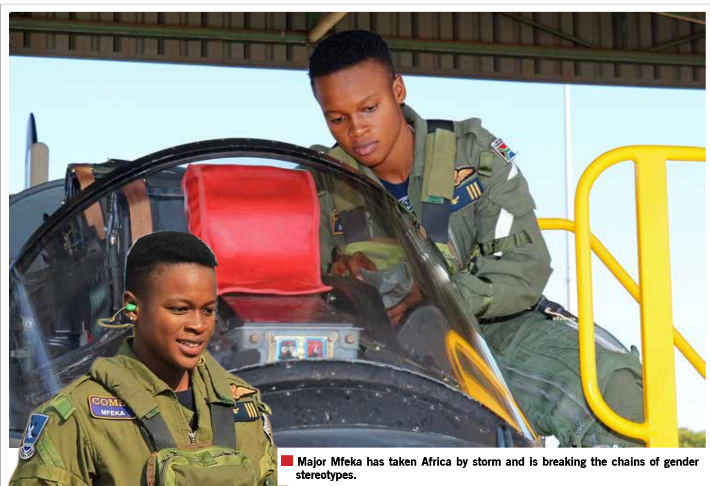
Major Mfeka has taken Africa by storm and is breaking the chains of gender stereotypes.