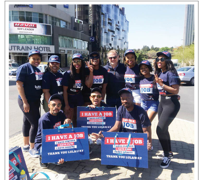
■ Lulaway het al meer as 30 000 jeugdiges van regoor Suid-Afrika in werks- of internskapeleenthede geplaas.

Kontak die NYDA deur 0800 52 52 52 te skakel of deur 'n e-pos aan info@nyda.gov.za te stuur.