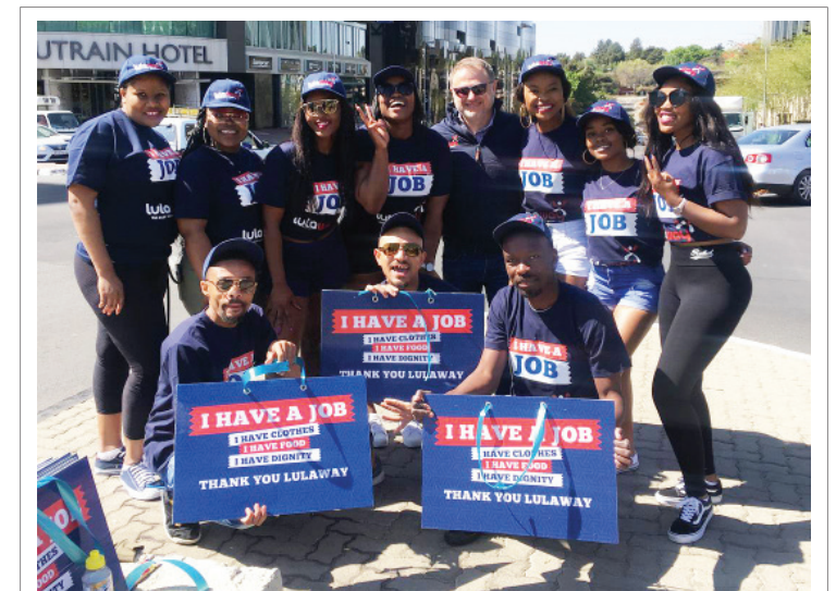
■ Lulaway e hweleditše bafsa ba go feta 30 000 mešomo goba dibaka tša go ithutela mošomo go phatlalala le Afrika Borwa.

“Bothata bjo ke bilego le bjona ke karolo ya katlego ya ka ka