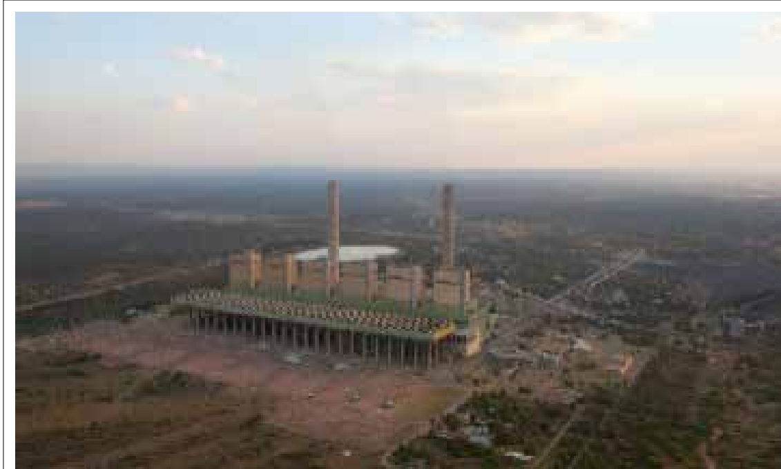
Die Matimba-kragstasie in Limpopo speel 'n deurslaggewende rol om krag in Suid-Afrika op te wek.

Matimba-kragstasie is in Lephallale, Limpopo, geleë. Mabotja verduidelik dat