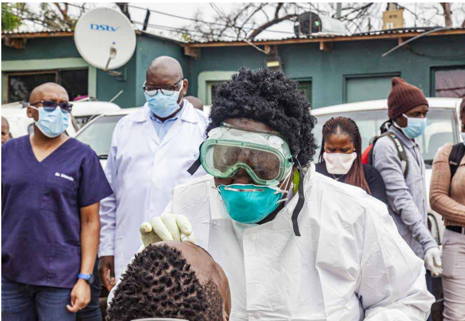
■ In the coming days and weeks, 10 000 Community Health Care Workers will be deployed across the country to conduct door-to-door screening in our most vulnerable communities