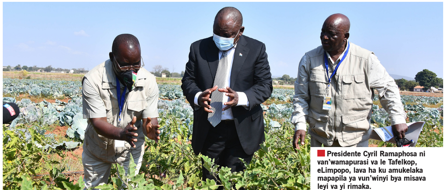
■ Presidente Cyril Ramaphosa ni van'wamapurasi va le Tafelkop, eLimpopo, lava ha ku amukelaka mapapila ya vun'winyi bya misava leyi va yi rimaka.

Hi 2000, khale ka Ndzawulo ya Tiko ya swa Vurimi yi endlile ntwanano wo lombisa ni nhlango no wa Tafelkop Farmers Association hi ku landza Phurogireme ya