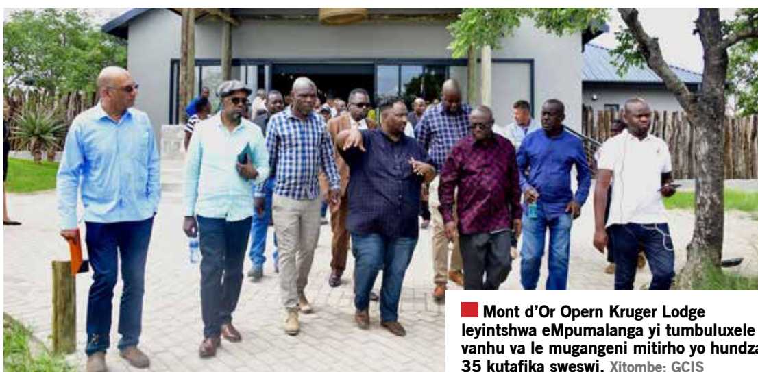
Mont d'Or Oporn Kruger Lodge leyintshwa eMpumalanga yi tumbuluxele vanhu va le mugangeni mitirho yo hundza 35 kutafika sweswi.