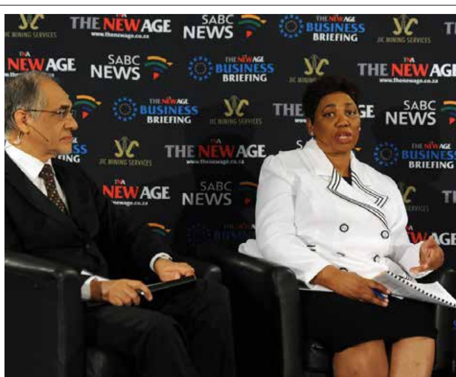
Minister Angie Motshekga en Adjunkminister Enver Surty stippel die departement se plan uit om onderwys in die land te verbeter tydens 'n ontbytssessie van die New Age-koerant.

Organisasies soos TeachSA gaan ook 'n deurslaggewende rol speel om 'n plan te ontwikkel vir die werwing, gebruik en ontwikkeling van onderwysers om die getal leerders wat WWT neem, te verhoog, asook om hul deelname en prestasie te verbeter.