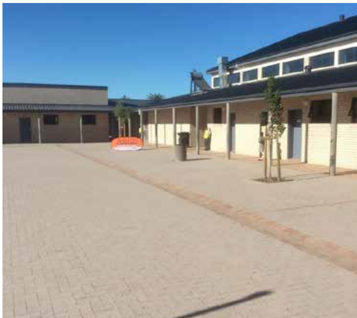
Die Regering bou tans skole waar leerders kan groei en onderwysers geïnspireer word om te onderrig. Hierdie skole sal help om standaarde te verhoog en 'n beter toekoms te bou.