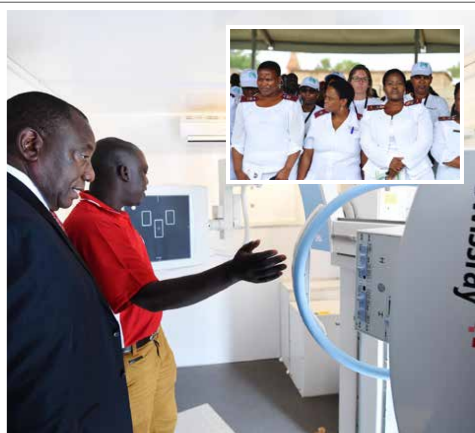
Adjunkpresident Cyril Ramaphosa inspekteer 'n TB-toetsmasjien. Meer as 200 gesondheidswerkers is opgelei in middelweerstandige-TB-medikasie.

"In hierdie ses distrikte wil ons sowat 5 miljoen gemeenskapslede en 1,2 miljoen kinders in skole, VKO-sentrums en crèches toets."