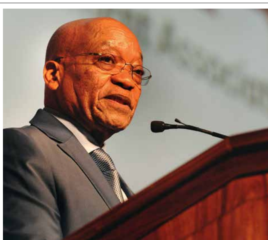
President Jacob Zuma sê baie meer moet gedoen word om die lewens van Suid-Afrikaners te verbeter.

Die President sê verskeie gemeenskappe sien reeds vordering in die sin dat hulle basiese