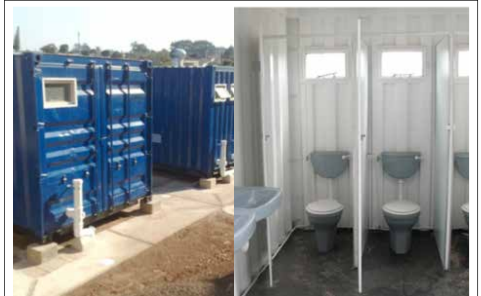
Die eThekweni Munisipaliteit se water-en-sanitasie-eenheid gebruik gemodifiseerde skeepshouers om uitdagings van sanitasie in informele nedersettings in die provinsie aan te pak.

Die Stad Tshwane gaan ook innoverend te werk om die lewens van sy mense te verbeter deur middel van digitale tegnologie