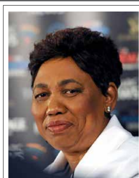
Die Minister van Onderwys, Angie Motshekga.

Die taakspan het ook bevind dat provinsies nie voldoende planne het vir eksterne ondersteuning of vennootskappe met die private sektor of nie-regeringsorganisasies (NRO's) nie.