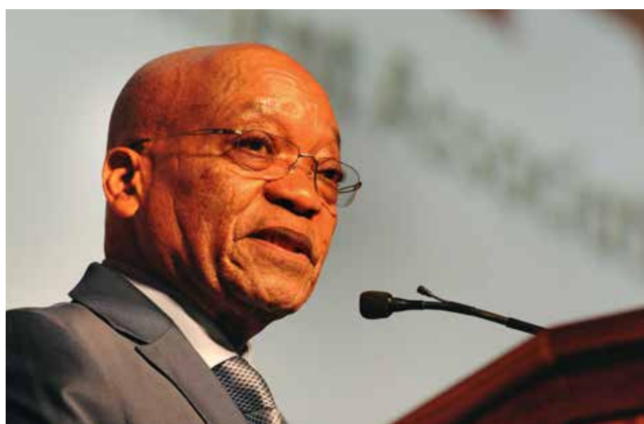
Moporesidente Jacob Zuma o re boholo bo ntse bo hloka ho etswa ho ntlafatsa maphelo a maAforika Borwa.

NMA ke kopano ya baetapele ba mmuso wa lehae ho tla hlalloba kगतelopele e entsweng mmusong wa lehae esita le ho fumana mekgwa ya ho matlafatsa mmuso wa lehae le ho ntlafatsa ditshebeletso.