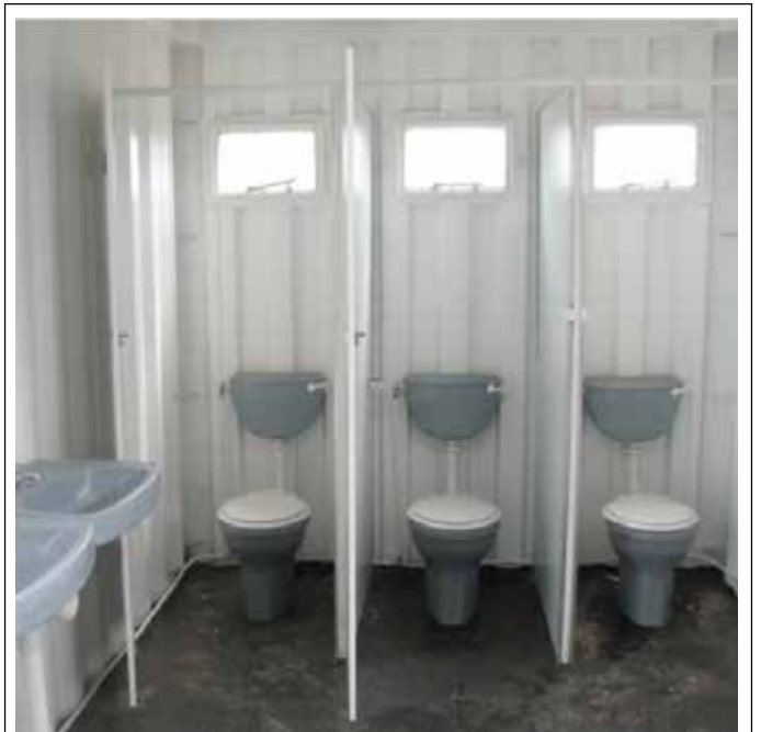
Yuniti ya Metsi le Tsamaiso ya Dikgwerekgwere ya Masepala wa eThekwini e sebedisa makopokopo a dikepe a hlabollotsweng ho sebetse tsa le diphephetso tsa tsamaiso ya dikgwerekgwere dibakeng tsa baipei porofenseng.

Mokgwa o mong o babatsehlang o thakgotsweng ke Motsemoholo ke wa DigiMbizo, mofuta wa dijithale wa