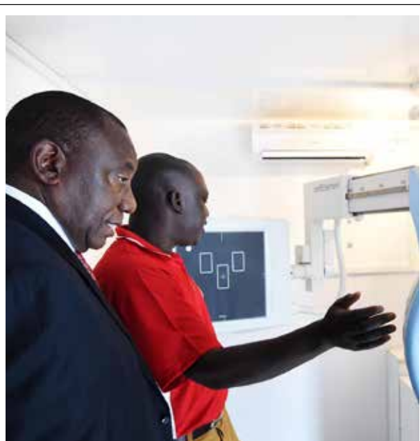
Motlatsi wa Moporesidente Cyril Ramaphosa o lekola motjhele o hlahlobisang TB. Basebetsi ba tsa bophelo bo botle ba fetang 200 ba rupelletswe ka kalafo ya TB e sa phekolweng ke meriana.

Ho netefatsa hore bakudi ba TB ba kala-fong ba a nwa ba bile ba phethela kalafo ya bona jwaloka ha ba e sehetswe ke basebetsi ba tsa bophelo bo botle, mmuso o tla qala ka mokgwatshebetso wa ho sala morao bakudi