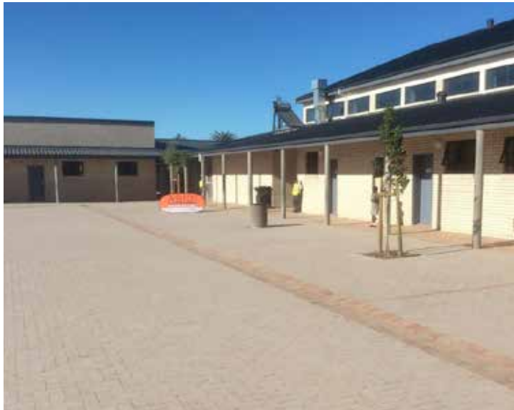
Mmuso o aha dikolo moo baithuti ba ka holang mme matitjhere a kgothaletswa ho ruta. Dikolo tsena di tla thusa ho nyolla maemo le ho aha bokamoso bo tjhatsi.