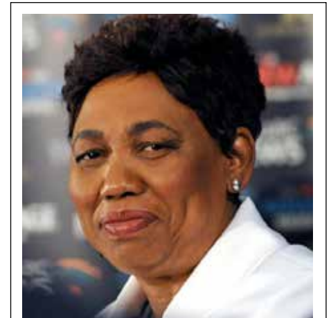
Letona la Thuto ya Motheo Angie Motshekga.

“Hangata sena se baka tshubuhlellano ya di-NGO dikolong, empa ho kena ha tsona ha ho a hlophiswa hantle. Hangata ba hlwaya dikolo tse se nang seabo se sa lekanang le