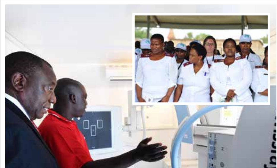
Xandla xa Phuresidente Cyril Ramaphosa a valanga muchini wo kambela TB. Ku tlula 200 wa vatirhi vai rihanyo va leteriwele hi murhi lowu tshungulaka TB leyi alaka ku tshunguriwa hi mirhi ya ntolovelo.

Mfumo wu tlhele wu boxa swifundzha swa ntsevu swa xirhangana eka pphumba ro kambela. Leswi ku nga Lejweleputswa eFree