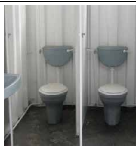
Yuniti ya Mati na Nkululo ya Masipala wa Thekwini yi tirhisa tikhotheyina ta swikepe leti nga cinciwa ku lwisana na mintlhotlo ya nkululo eka tindzhawu ta swidakana exifundzankulu.

lowu tirhisaka tindlela tintshwa ku antswisa vutomi bya vanhu hi ndlela yintshwa ya thekinoloji ya xidijiti leyi vuriwaka Phurojeke Isizwe.