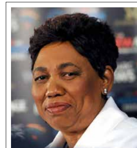
Holobywa wa Dyondzo ya Masungulo Angie Motshekga.

"Leswi swi endla leswaku ku va ni ti-NGO to tala eswikolweni, kambe ku nghenelela