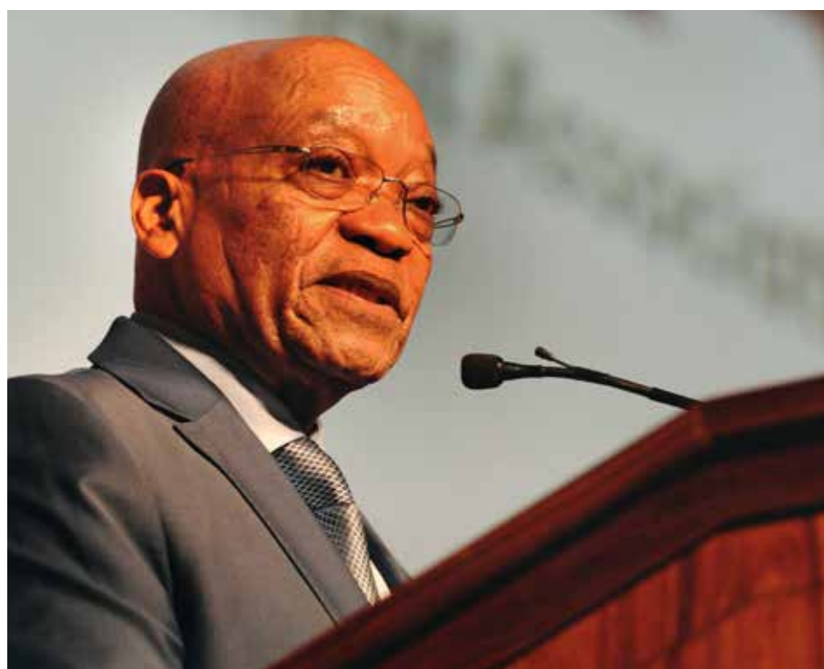
Phuresidente Jacob Zuma u vula leswaku swotala swifanele ku endlila ku antswisa vutomi bya maAfrika-Dzonga.

leri a ku ri " Ku tlangela 15 wa malembe ya Xidemokirasi xa Mfumo wa Muganga. Ku tlhelela emasunguleni ku tiyisisa no entisanhluvuko na xidemokirasi lexi tirhelaka vanhu va miganga."