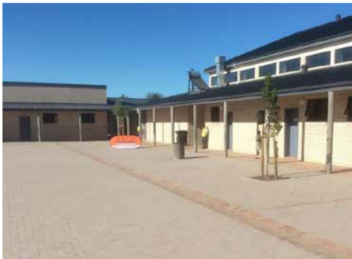
Mfumu wu le ku akeni ka swikolo laha vadyondzi va nga ta kula naswona vadyondzisi va hlohloleka ku dyondzisa. Swikolo leswi swi ta tlakusa mpimo na ku aka vumundzuku bya kahle.