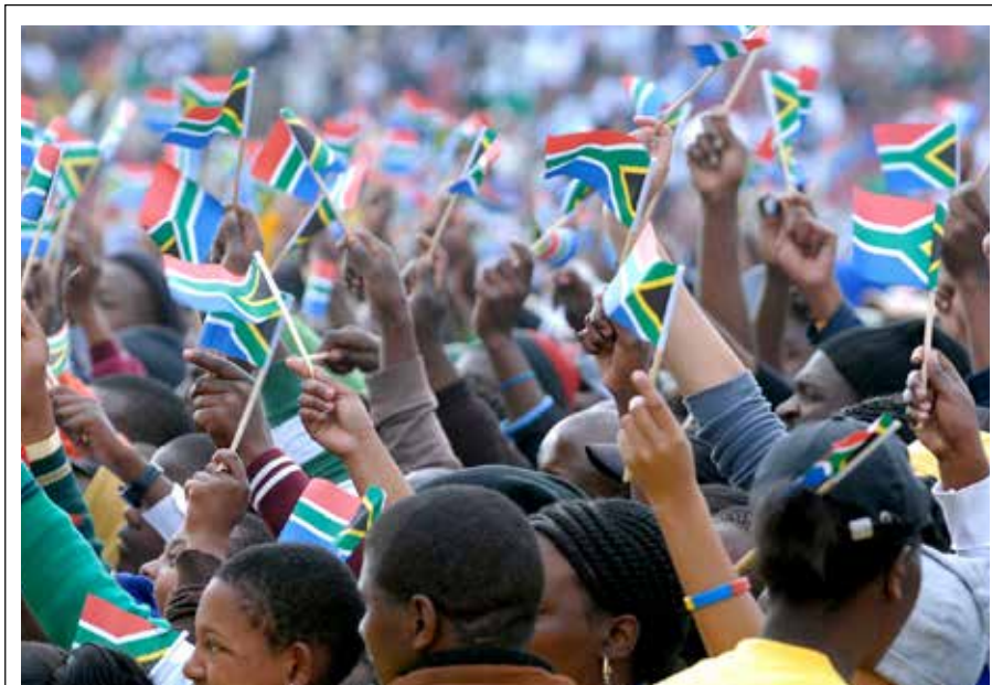
Kha ri shumisane roṭhe u itela u fhaṭa Afrika Tshipembe ḡa khwine.

U fhaṭa Afurika Tshipembe zwi thoma nga ngomu; kha ri dzehene fhasi ri shume.