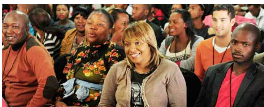
Mbekanyamatele ya Lushaka ya Vhaswa ya 2015-2020 i ḡo fha vhaswa tshikhala tsha u bvelela na u shela mulenzhe kha u fhaṭa ekonomi.

U ya nga vha Mbalombalo dza Afrika Tshipembe (StatsSA), vhaswa vha vhubamba 40% ya vhadzulapo vha Afrika Tshipembe nahone vha