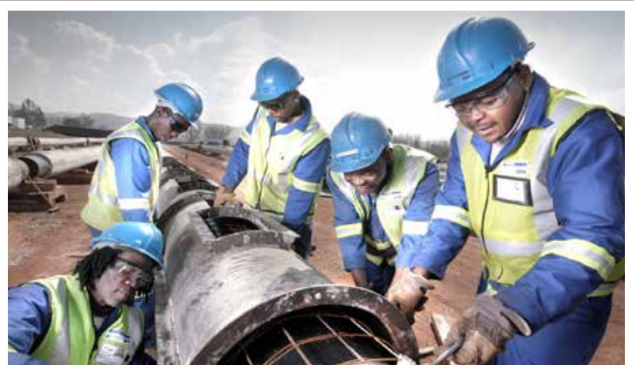
Thandela dza themamveledziso dzine dza khou itea shango ḡṭhe dzi khou thusa nyaluwo ya ikonomi yashu. Fhedziha, maAfrika Tshipembe ri tea u shandukisa nyimele ya mbilu na kuhumbulele kwashu u itela u thusa uri lushaka lu aluwe lu tshi ya phanḡa.

Mivhigo nga vhoramafhungo i ri munna o vho-