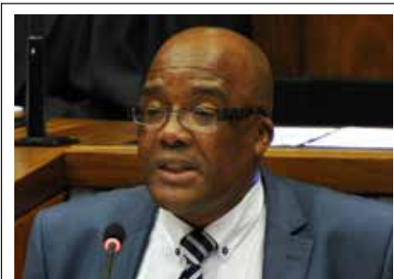
Minisiya wa Mutakalo Vho Aaron Motsoaledi vha ri muhasho wavho u do ita uri vhatu vha wane ndondolo ya mutakalo ya ndeme yavhuqi.

“Vhasasaladzi vha nga amba zwine vha nga amba, a ri nga litshi kana u shaisa maanga tshitenwa tsha u thivhela malwadze kha sisiteme ya mutakalo. Tshitenwa tsha u thivhela malwadze tshi do vha mutheo wa mbekanyamushumo yashu ya u khwathisa sisiteme ya mutakalo.”