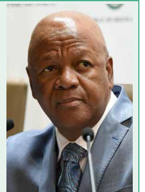
Minisiḁa Vho Jeff Radebe.

"Mawanwa mahulwane a sumbedza uri tsho ha thoḁwa tshikimu tsha ḁhuthuwedzo, ho no sikwa mishumo i fhiraho 9 000 na uri sekithara ya BPS ndi sekithara khulwane kha u kunga vhubindudzi na u sika mishumo, nga maanḁa