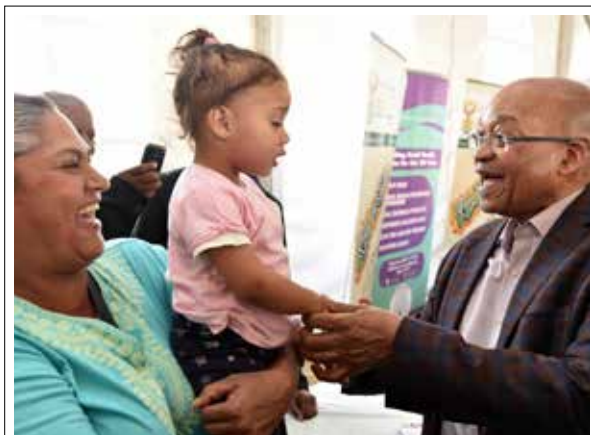
President Jacob Zuma het Eersterust besoek om met die gemeenskap saam te werk om oplossings vir hul probleme te vind.

“Ongeveer 69 misdaadintelligensie-operasies is tot dusver in die area uitgevoer, wat gelei