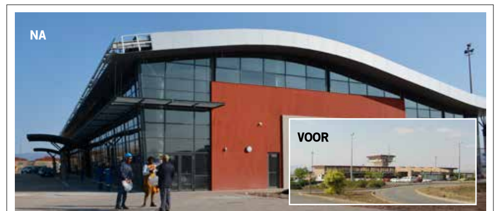
Die Mthatha Lughawe sal nie net die ekonomie 'n hupstoot gee nie, maar sal ook die aantal werksgeleenthede in die provinsie vermeerder.

“Die ongekende belegging in hierdie lughawe