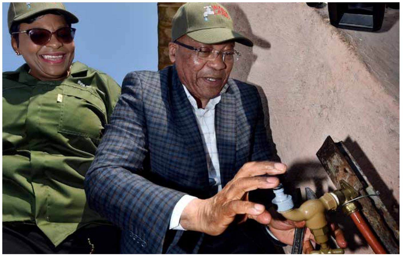
President Jacob Zuma, hier saam met die Minister van Waterwese en Sanitasie, Nomvula Mokonyane, het 'n waterbesparingsprogram bekend gestel wat ook opleidingsgeleenthede vir duisende jeugdige sal skep.

"Die Oorlog teen Lekkassies-program sal nie net ons water bespaar nie, maar sal vol-