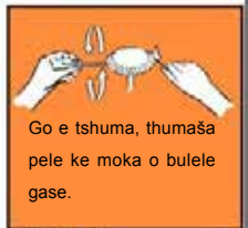
Go e tšuma, thumaša pele ke moka o bulele gase.