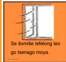
Se šomiše lefelong leo go tsenago moya.