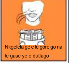
Nkgelela ge e le gore go na le gase ye e dutlago