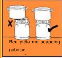
Bea pitša mo seapeing gabotse.