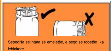
Sepediša selintara se emeletše, e sego se robetše ka lehlokore.