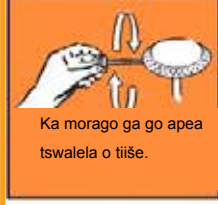
Ka morago ga go apea tswalela o tiše.