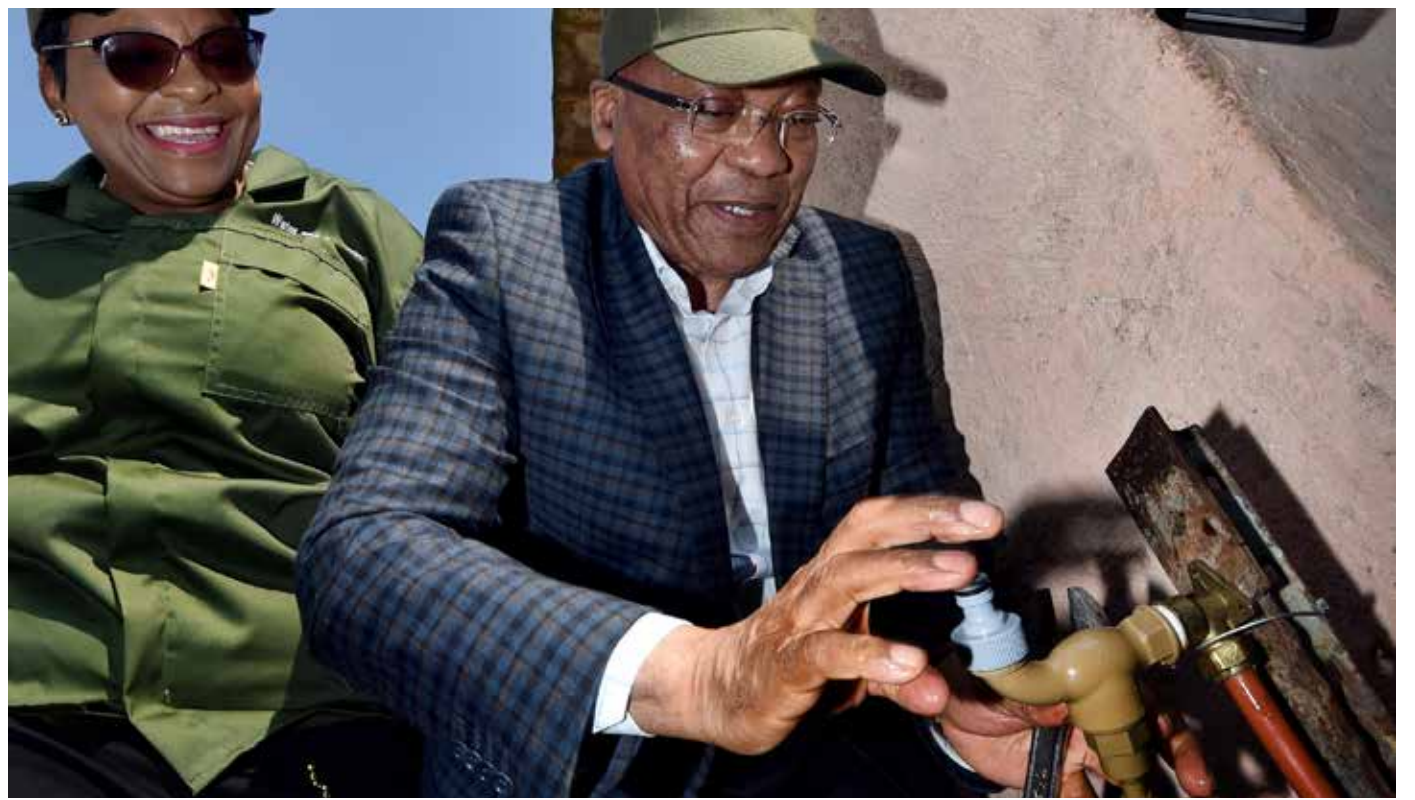
Muphuresidennde Vho Jacob Zuma, vha khou vhonala vha na Minisiya wa zwa Maqi na Vthathathshili Vho Nomvula Mokonyane, hu tshi khou rwelafari mbekanyamushumo ya u vhlunga maqi ine ya qo vula zwikhala zwa u pfumbudza zwigidi zwa vhaswa.

"Kha Mulaedza wavho wa Lushaka, Muphuresidennde vho thahisa mbilaelo yavho ya ngaha ndozwo ya maqi u mona na shango zwi duraho masheleni a fhirira R7 bilioni nga nwaha zwo vhangwa nga themamveledzo dza kale kha u bvuda ha maqi. Ri na maqi manzhi a sa kale.