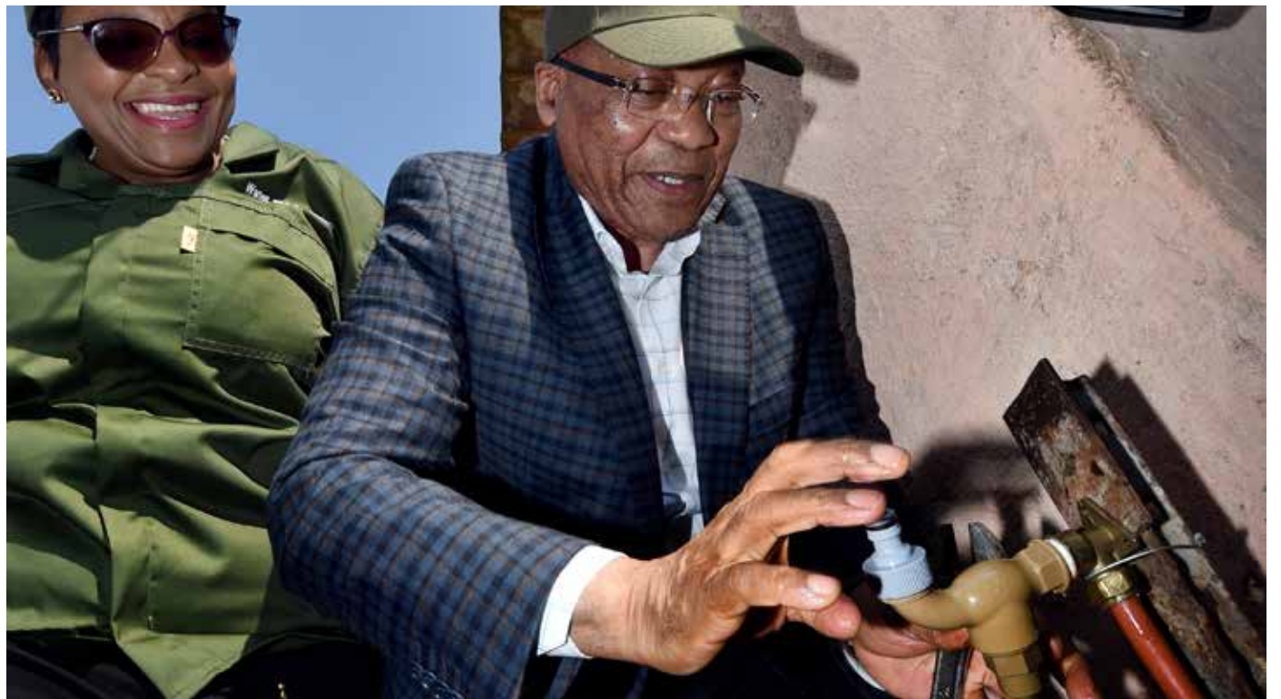
Phuresidente Jacob Zuma, u voniwa laha na Holobye wa Mati na Nkululo Nomvula Mokonyane, u simekile phurogireme yo hlayisa mati leyi nga ta tumbuluxa swivandla swa vuleteri eka eka magidi ya vantshwa.

"Eka Mbulavulo wa yena hi Xiyimo xa Rixaka, Phuresidente u humesile xivilelo hi ku engeteleka hi lembe hi kwalomuya ko tlula R7 biliyoni