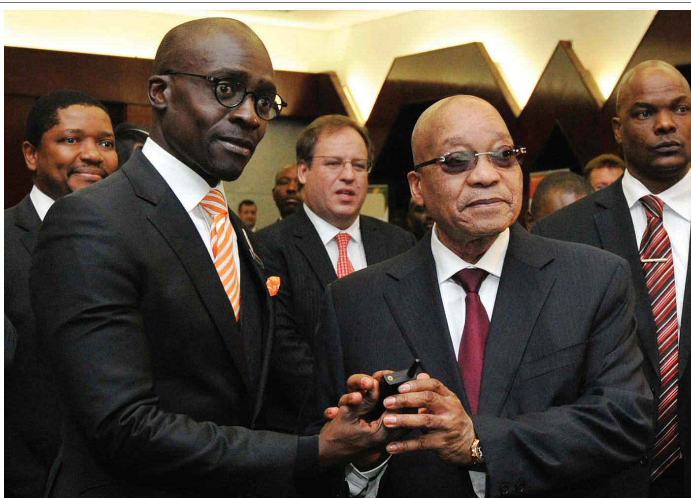
President Jacob Zuma en die minister van binnelandse sake, Malusi Gigaba, tydens die bekendstelling van e-HomeAffairs .