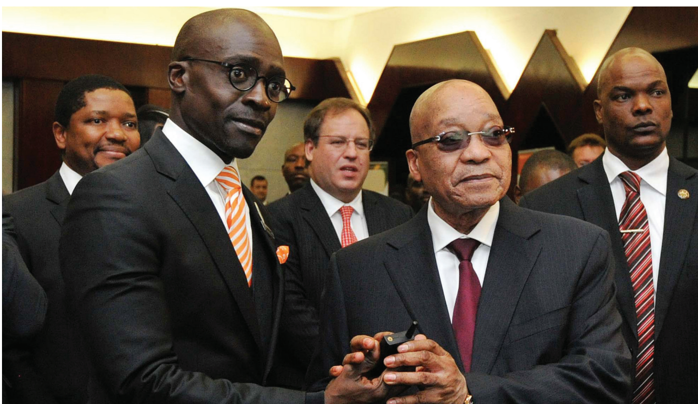
Mopresidente Jacob Zuma le Tona ya Merero ya Selegae nakong ya ge go tsebagatšwa lenaneo la e-HomeAffairs.