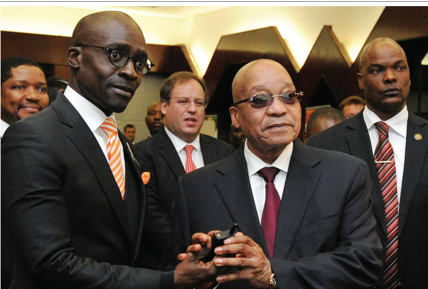
Moporesidente Jacob Zuma le Letona la Merero ya Lehae Malusi Gigaba nakong ya ho thakgolwa ha lenaneo la e-HomeAffairs .