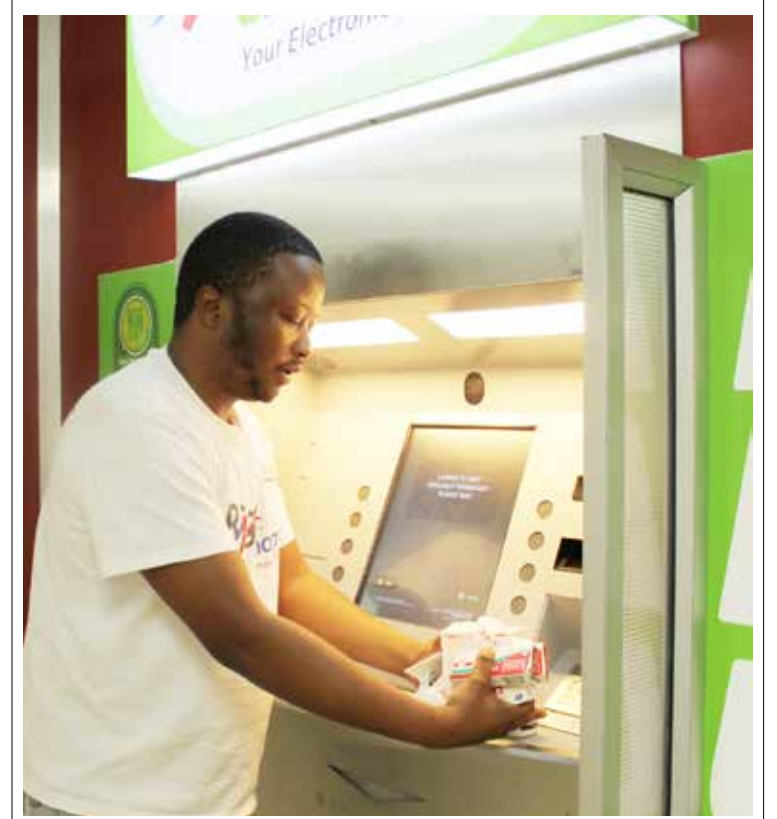
Die OTM-tipe Pharmacy Dispensary Unit sal vir pasiënte toegang tot gehalte gesondheidsorg bied.

“Die aantal pasiënte op behandeling het oor drie dekades van 400 000 tot meer as 3,4