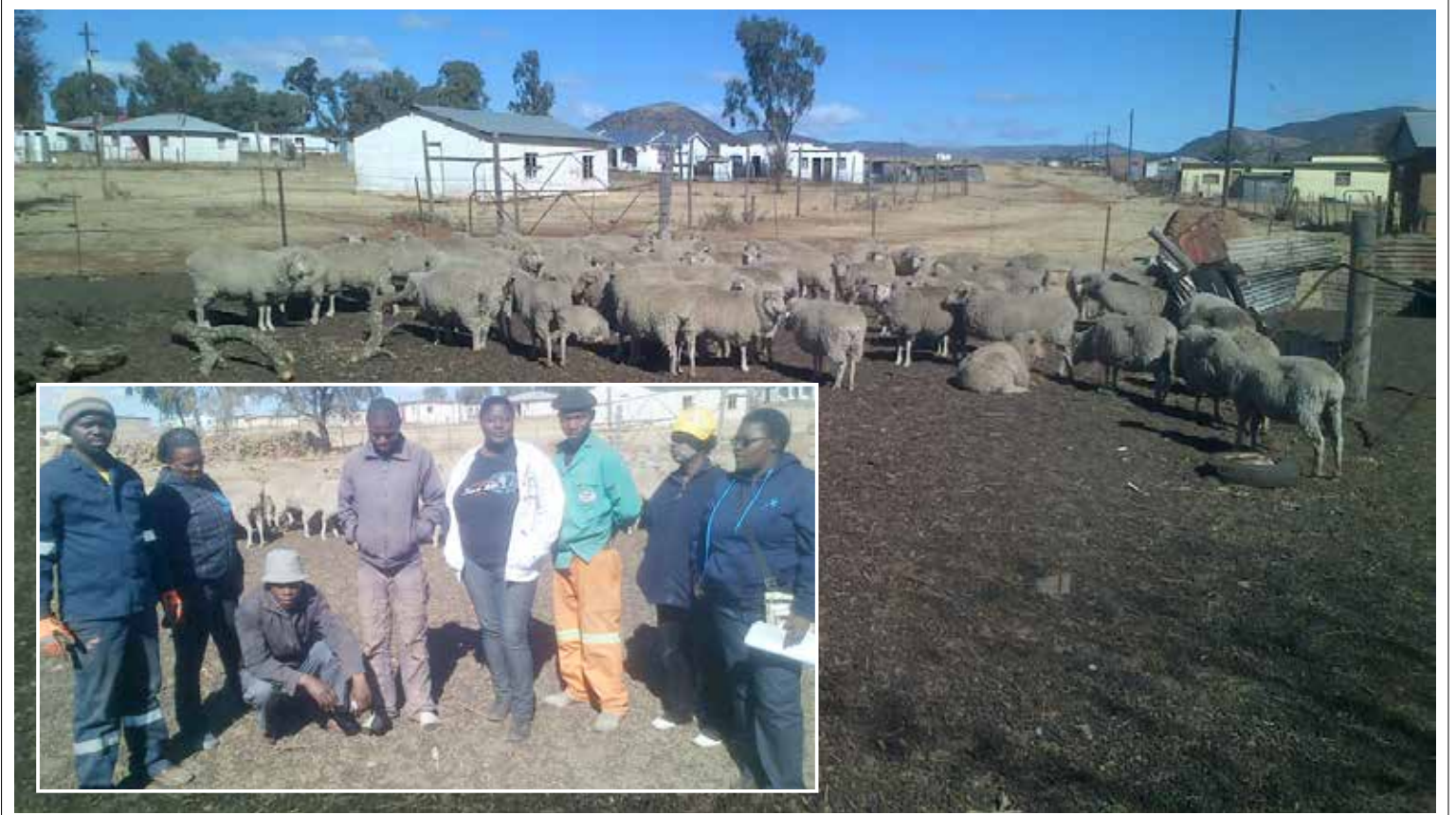
Lede van die Zulukama Gemeenskapstrust bedryf suksesvolle wolwersamelpunte naby Whittlesea, Oos-Kaap.