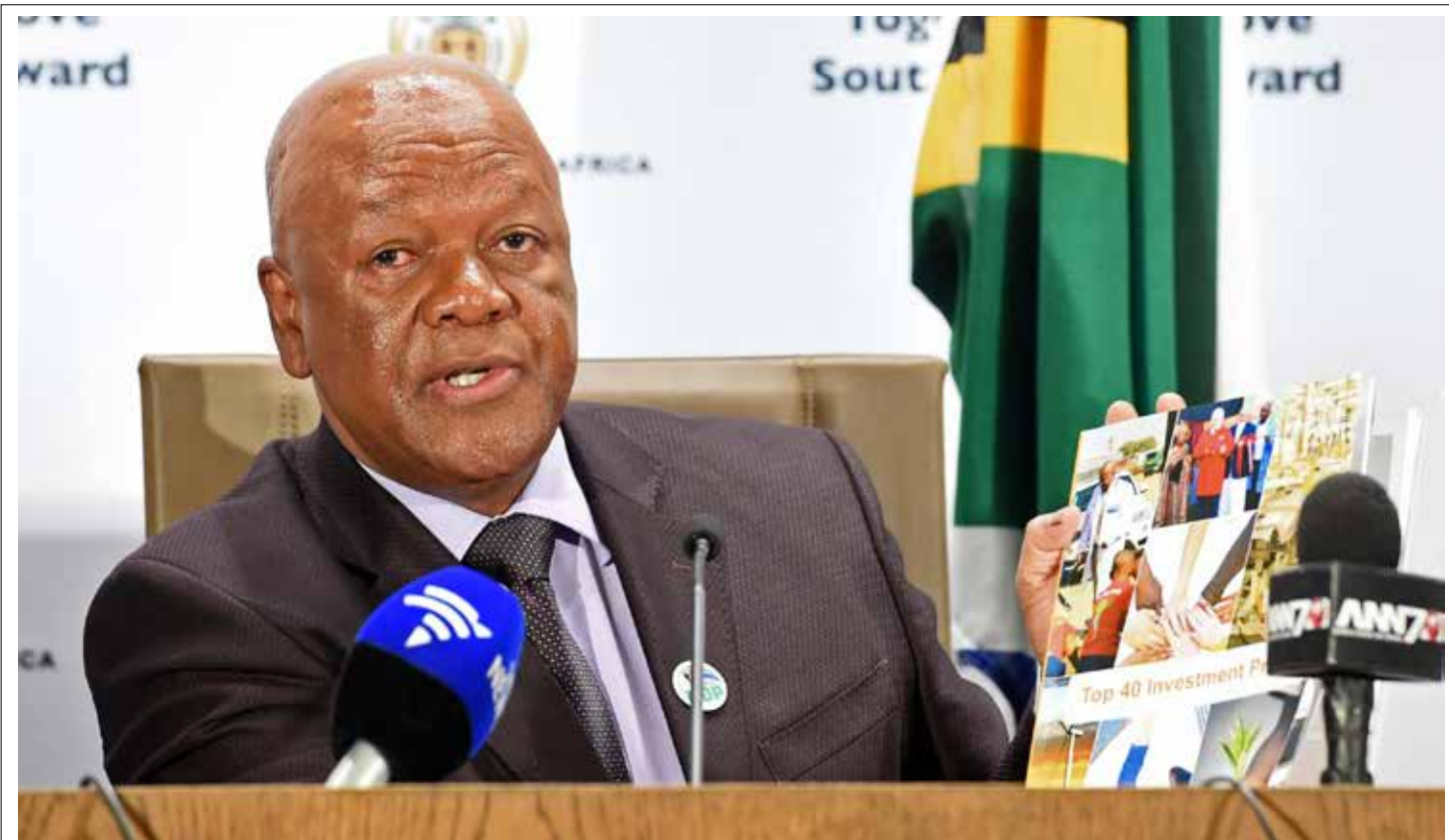
Minister in The Presidency for Planning, Monitoring and Evaluation, Jeff Radebe announced a plan to support small business and cooperatives.