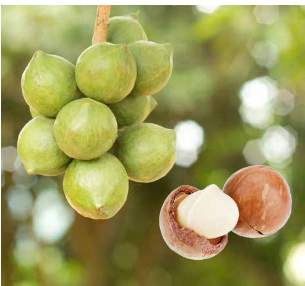
Makadamianeute van 'n goeie gehalte word op verskeie plekke in die Oos-Kaap gekweek.

“Ons het 'n verantwoordelikheid om mense uit armoede op te hef en seker te maak dat daar welvaartskepping in die landelike gebiede is om te keer dat kinders net hul heil in die stede gaan soek.” ■