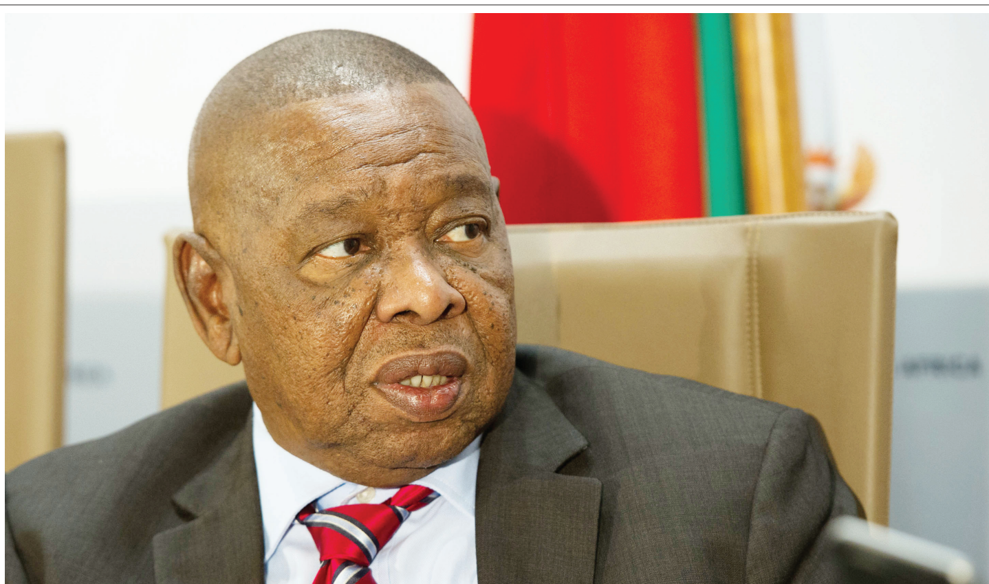
Higher Education and Training Minister Blade Nzimande says government wants to strengthen post-school learning and teaching.