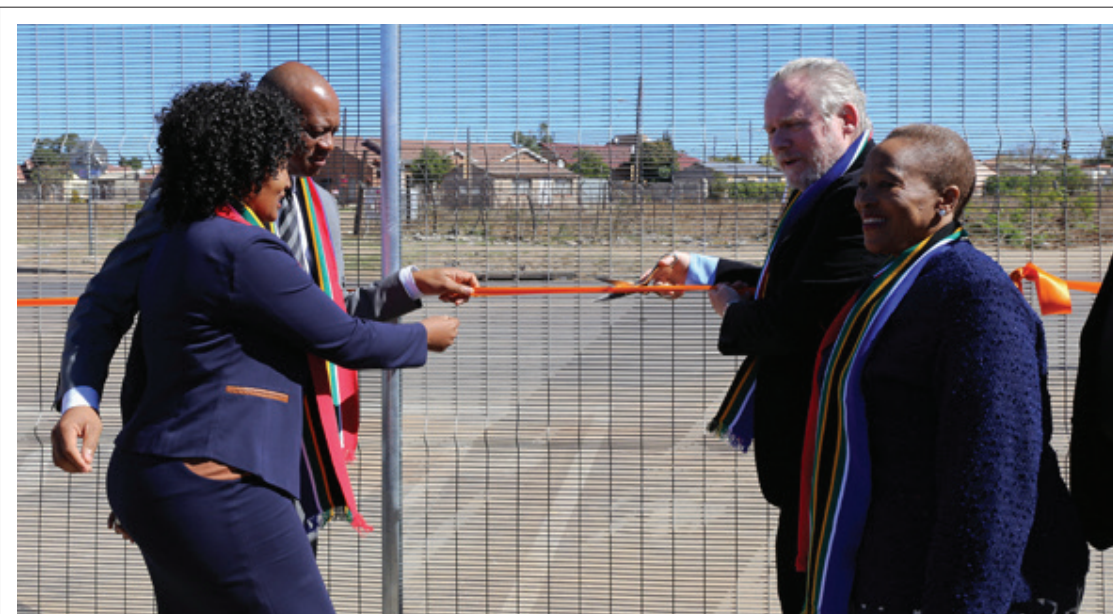
The Department of Trade and Industry spent R21 million for the first phase of the Seshego Industrial Parks.