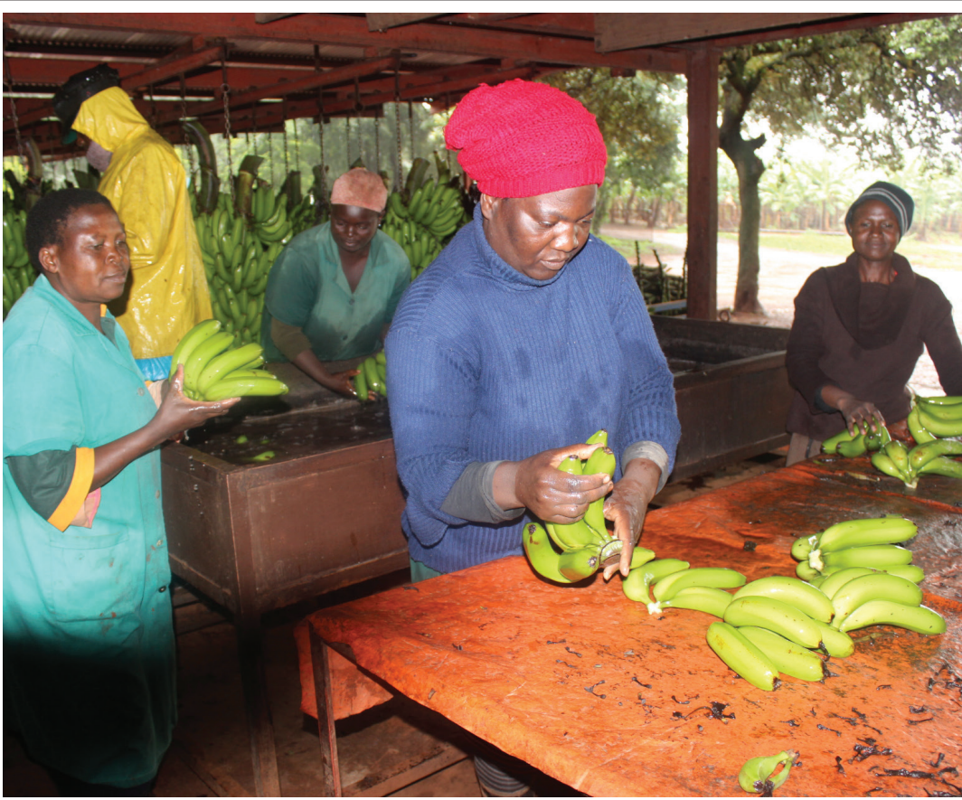
Werknemers by die Ravele GEV was varsgeplukke piesangs by die GEV se pakhuis. Die piesangs sal by plaaslike markte oral in Limpopo verkoop word.

DIE RAVELE GEMEENSKAPSEIENDOMVERENIGING (GEV) het gemengde sukses behaal met die verbouing van hul grond ná 'n suksesvolle grondeis. Vandag verkoop hulle hul produkte met groot sukses plaaslik sowel as oorsee.