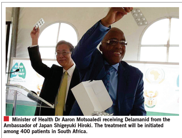
■ Minister of Health Dr Aaron Motsoaledi receiving Delamanid from the Ambassador of Japan Shigeyuki Hiroki. The treatment will be initiated among 400 patients in South Africa.

Die Europese Medisyne-agentskap het die middel in 2014 goedgekeur vir die behandeling van volwasse pulmonale VMW-TB.