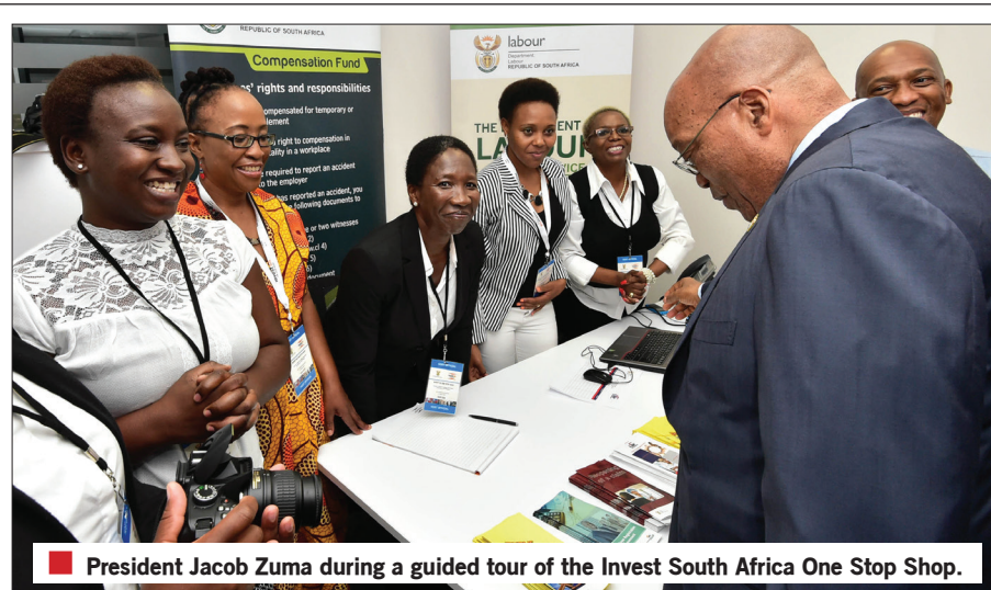
■ President Jacob Zuma during a guided tour of the Invest South Africa One Stop Shop.

Launching InvestSA President Jacob Zuma said The One Stop Shop will provide a more coordinated, streamlined and professional service to those who wish to set up a business," President Zuma. ■