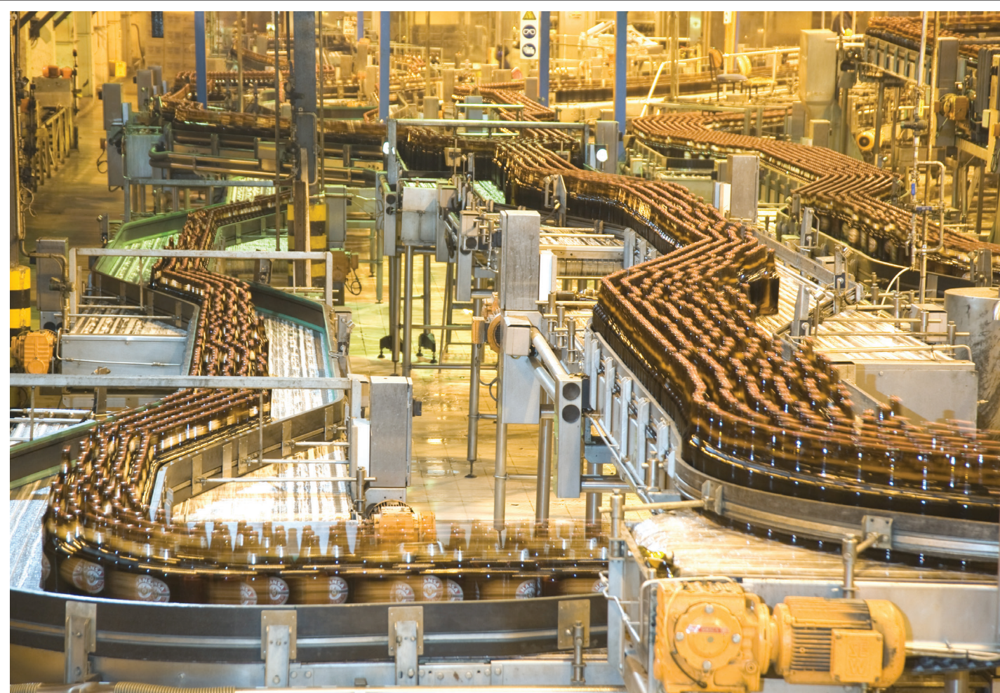
■ To bring about fundamental change in our economy we need more real industrialists, people who own manufacturing businesses and are not just shareholders in someone else's company.