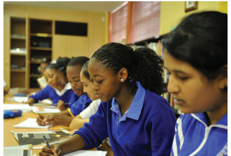
Leerders presteer beter in hoërskool as hulle in hul vroegste skooljare gehalteonderwys ontvang het.