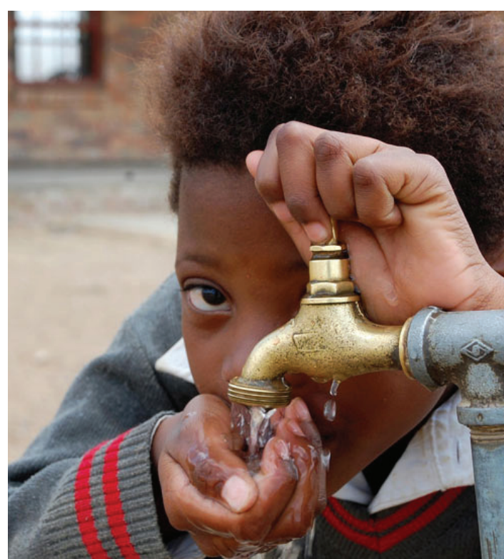
■ Suid-Afrikanners is gesonder met beter onderwysvlakke, volgens 'n Stats SA-verslag.

of word deels van hernubare energie voorsien. Die aantal geëlektrifiseerde huishoudings het van 77 persent in 2002 tot 84.2 persent verlede jaar gestyg.