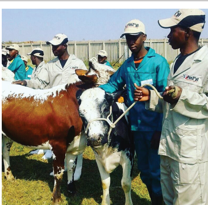
Veeartsenywetenskap is een van die vakke wat by die Magaliesburg Spesialiseringsskool onderrig word.

DIE GAUTENG ONDERWYSDEPARTEMENT se nuwe spesialiseringsskool wat onlangs in Magaliesburg geopen is, is een van 27 hoërskole wat daarop gerig is om leerders se praktiese ervaring in sleutelvaardighede wat nodig is om die ekonomie te laat groei te verbeter.