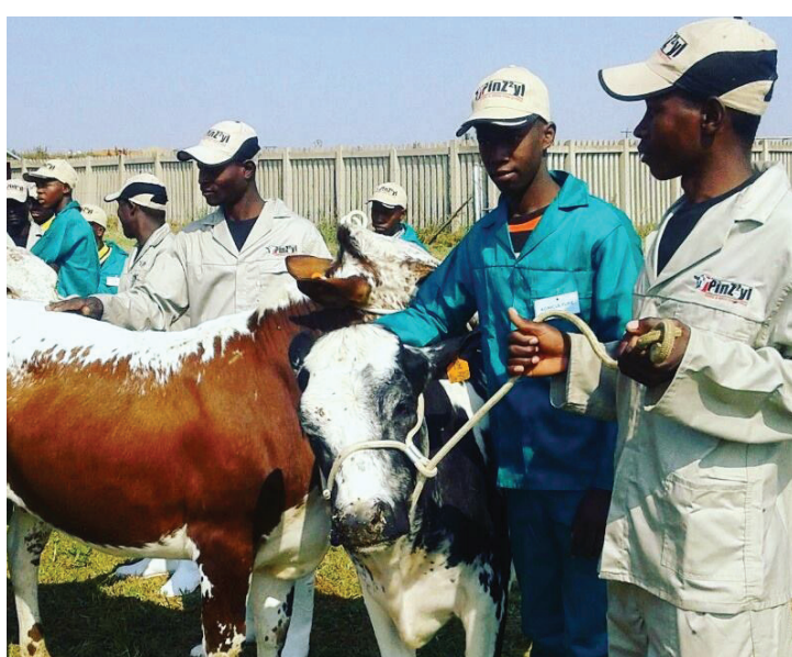
■ Saense ya Thutadiphoofolo ke ye nngwe ya dirutwa tše di rutwago Sekolong sa Magaliesburg sa go Ikgetha.

SEKOLO SE SESWA sa go ikgetha sa Kgoro ya Thuto se se thakgotšwego malobanyana go la Magaliesburg ke setee sa dikolo tše di phagamego tše 27 tše di hlaolešwego go kaonafatša boitemogelo bja go kgathatema ga baithuti ka bokgoning bjo bohlokwa bjo bo nyakwago go godiša ekonomi.