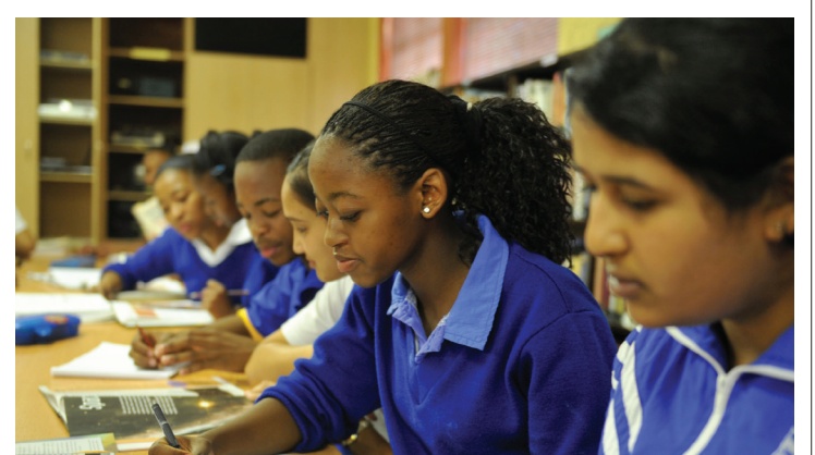
■ Baithuti ba šoma botse dikolong tše di phagamego ge ba amogetše thuto ya boleng mengwageng ya bona ya mathomo ya go tsena sekolo.

ditlhahlobong tša NSC tša 2016, mola ka saense dipalo tša 2016 di laetša gore baithuti ba 28 500 ba fihleletše 60%.