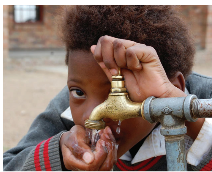
MaAfrika Borwa a itekanetše mmeleng, a rutegile ka bontši, go ya ka pego ya Stats SA.

Ka 2016, maAfrika Borwa a go balelwa go 86.9% a bogolo bja mengwaga ya ka godimo ga ye mehlanoo a tsenego diinstitšhušeng tša thuto ba sekolong, mola 4.8% ye nngwe e tsena diinstitšhu-