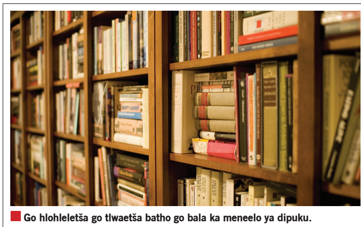
Go hlohletša go tlwaetša batho go bala ka meneelo ya dipuku.

"Batho bjale ka baetapele ka toropong ye re laeditše gore ba badile gagolo dipuku ka moka ka makgobapuku a bona le gore ga se dipuku tše ntši tše diswa tše di amoge-