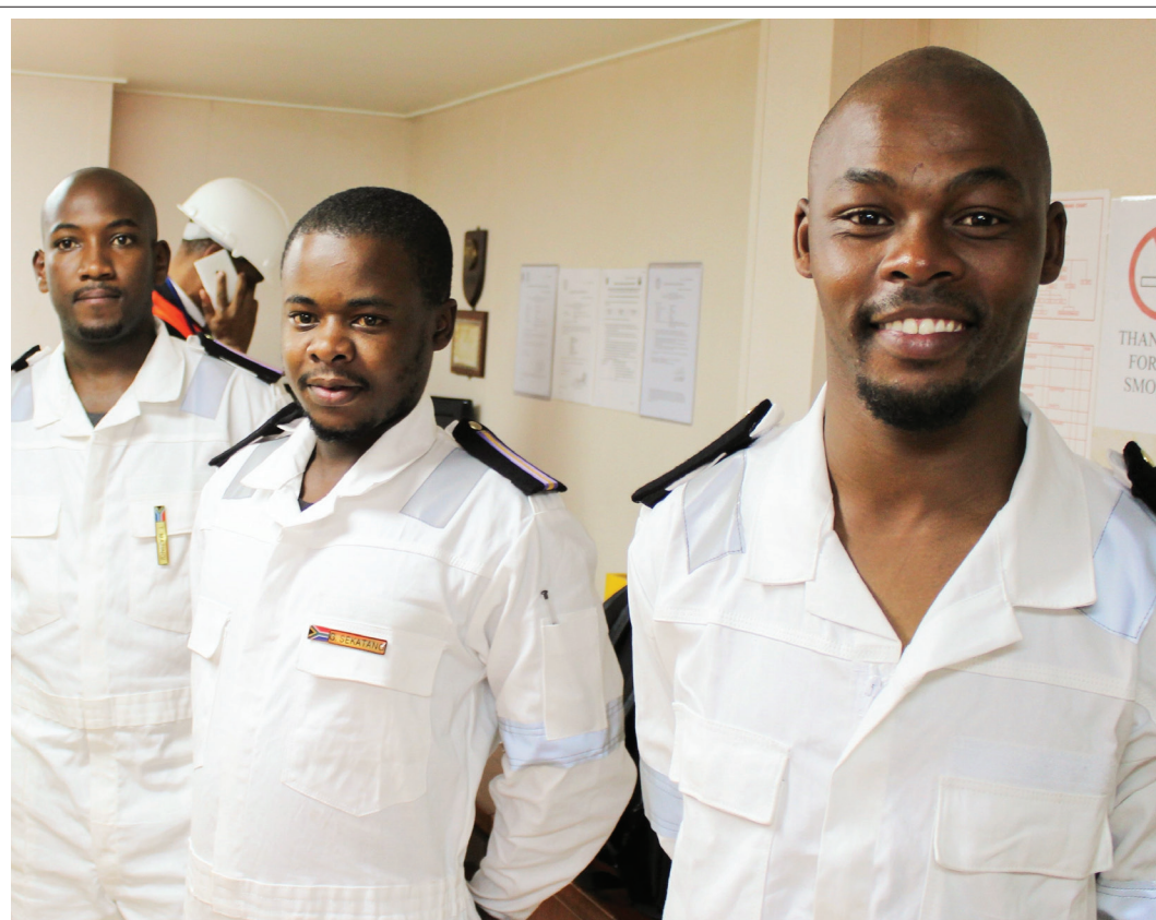
■ The Eastern Cape Maritime Youth Development Programme gives the youth skills and creates jobs in the maritime sector.

Joint partners in the initiative are the South African Maritime Safety Authority (SAMSA), the Eastern Cape Provincial Government and Harambee.