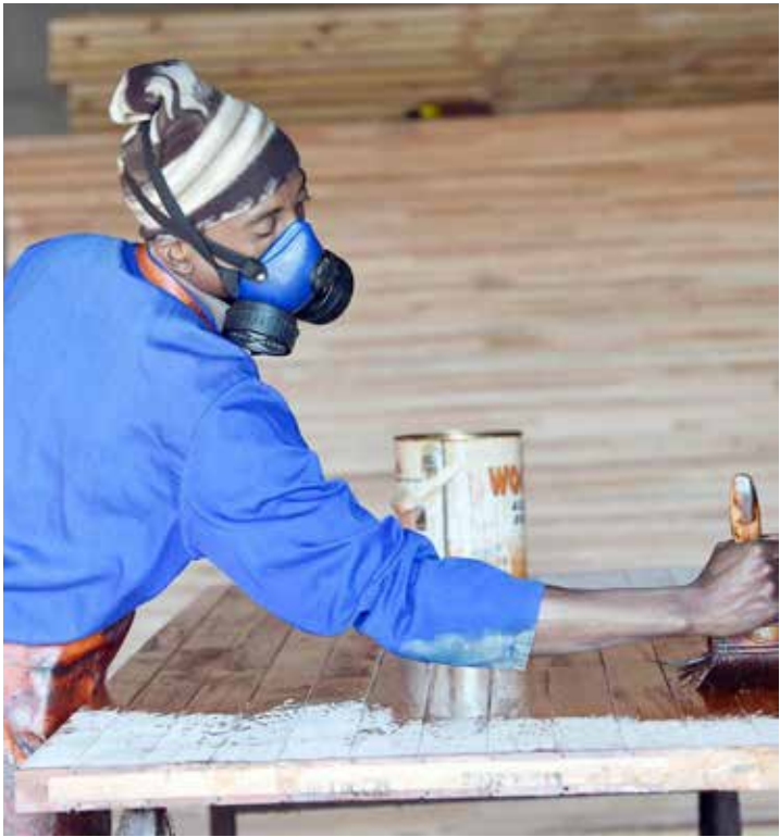
■ Ehansi ka NMW, vatirhi eka tisekitara to tala va fanele ku holeriwa mali leyi nga riki ehansi ka R20 hi awara.