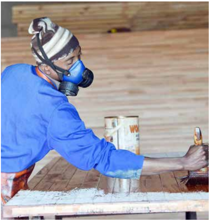
■ Ka mogolo o o kwa tlase wa bosetšhaba, badiredi ba makala a le mantsi ba tla tshwanelwa ke go duelwa mogolo o o seng ka fa tlase ga R20 ka ura.